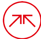
WAGON SUPPLIER DEVELOPMENT