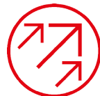
WAGON EXCELLENCE SYSTEM