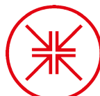
SAFETY AT WORK