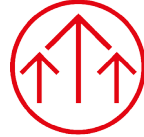
WAGON PEOPLE EMPOWERMENT