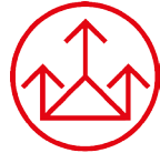
WAGON ENVIRONMENT AND ENERGY